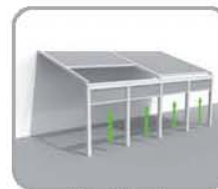
拉古纳®+多个 正置结构