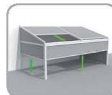
拉古纳®+防风且能全封闭 的正面及侧面结构