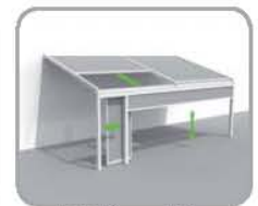
拉古纳®+正面结构+ Loggiawood®雪松 实木滑动百页门或 Loggiascreen®4fix 玻纤布料滑动门