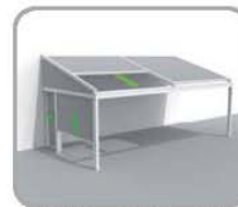
拉古纳®+三角结构+侧面玻 纤结构+Loggiawood®雪松 实木滑动百页门或 Loggiascreen®4fix 玻纤布料滑动门