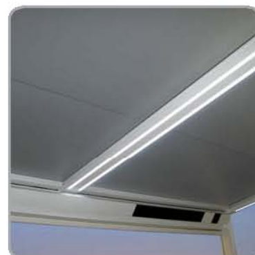
拉古纳®Beam取暖音响模块 + 照明模块