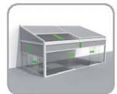
拉古纳®+玻璃滑动门 配正面、侧面玻纤结构