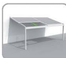
拉古纳®=基本框架+屋顶结构 =支撑结构+防风、 防风且半透明的玻纤遮阳帘

该系列然颂®露台遮阳棚之所以如此独特，是因为它的结构提供了防风 and 遮阳相结合的功能。其基本款产品可以由完全防风且半透明的遮阳帘封闭。有了这种革新性的露台遮阳棚，您可以在您自家的花园的露台，亦或是您最喜欢的酒吧或餐厅的露台，一年四季，不受天气限制来享受美好的户外生活。