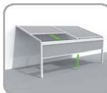
拉古纳®+防风且能 全封闭的正面结构