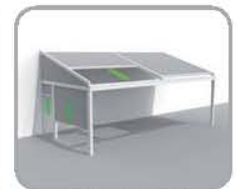
拉古纳®+三角结构+侧面 玻纤结构 (防风且能全封闭)