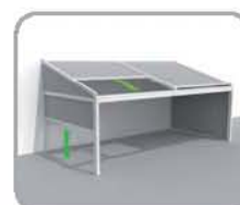
拉古纳®+防风且能 全封闭的侧面结构