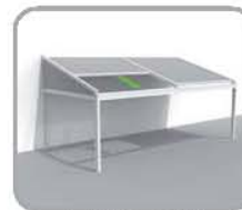
拉古纳®+三角结构 侧面仅封闭三角部分