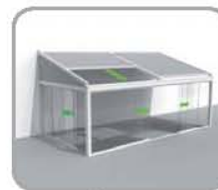
拉古纳®+玻璃滑动门 (正面或侧面)