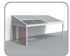
拉古纳®+三角结构+ Loggiawood®雪松 实木滑动百页门或 Loggiascreen®4fix 玻纤布料滑动门